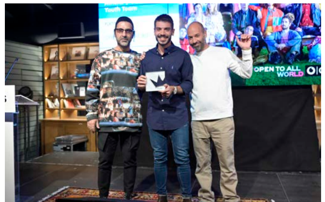
Platinum - Wunderman Thompson | Vodafone Youth Team