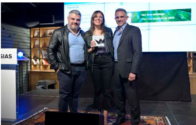
Platinum - Ομιλος ΟΤΕ | Httpool