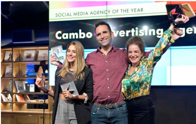
Social Media Agency of the Year - Cambo Advertising Agency