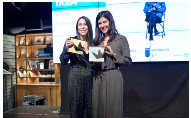
Platinum - Ikea