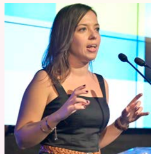
Μαρία Μανωλιούδη co-Jury President

Εύχομαι αυτές οι τάσεις να συνεχιστούν και να δώσουν τις ελληνικές επιχειρήσεις να πρωτοπορούν στην καινοτομία με ακόμα πιο δυνατές υποψηφιότητες την επόμενη χρονιά».