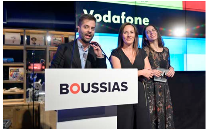
Social Media Brand of the Year - Vodafone