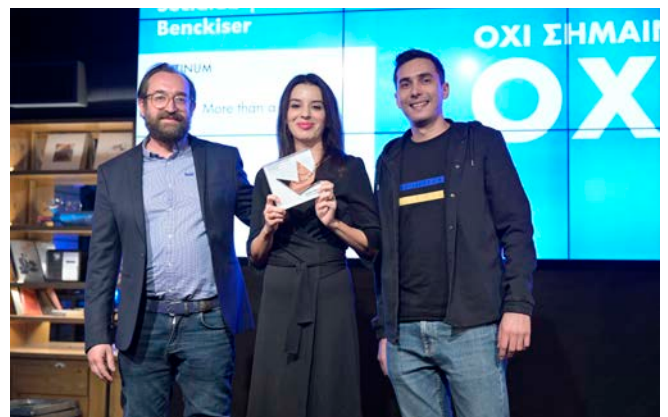
Platinum - Sociallab | Reckitt Benckiser - Durex