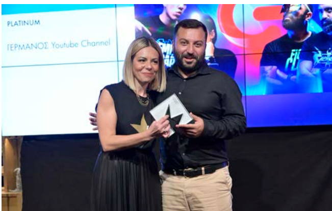
Platinum - Digital Minds | Γερμανός