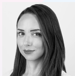
Χρύσα Χατζησάββα co-Jury President

Από την πλευρά της, η Χρύσα Χατζησάββα, co-Jury President της διοργάνωσης, παρατήρησε ότι οι δυσκολίες της φετινής χρονιάς ώθησαν όλους να σκέφτονται πιο δημιουργικά και με μεγαλύτερη συναίσθηση του πώς πράττουν. «Αυτή η τάση ήταν ιδιαίτερα έκδηλη στα εφετινά Social Media Awards. Αξιολογήσαμε υποψηφιότητες πολύ υψηλού επιπέδου που δεν είχαν σε τίποτα να ζηλέψουν από καμπάνιες του εξωτερικού. Προσωπικά ένιωσα περήφανη κατά τη διάρκεια της αξιολόγησης. Αξίζει δε να σημειωθεί ότι είδαμε εξαιρετικές προσπάθειες από εταιρείες μικρότερες και σχετικά καινούργιες στον χώρο και αυτό είναι ένα ρεύμα που ελπίζω να συνεχιστεί και τα επόμενα χρόνια».